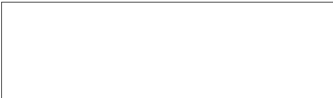
Figure 1 : Titre (Source :)